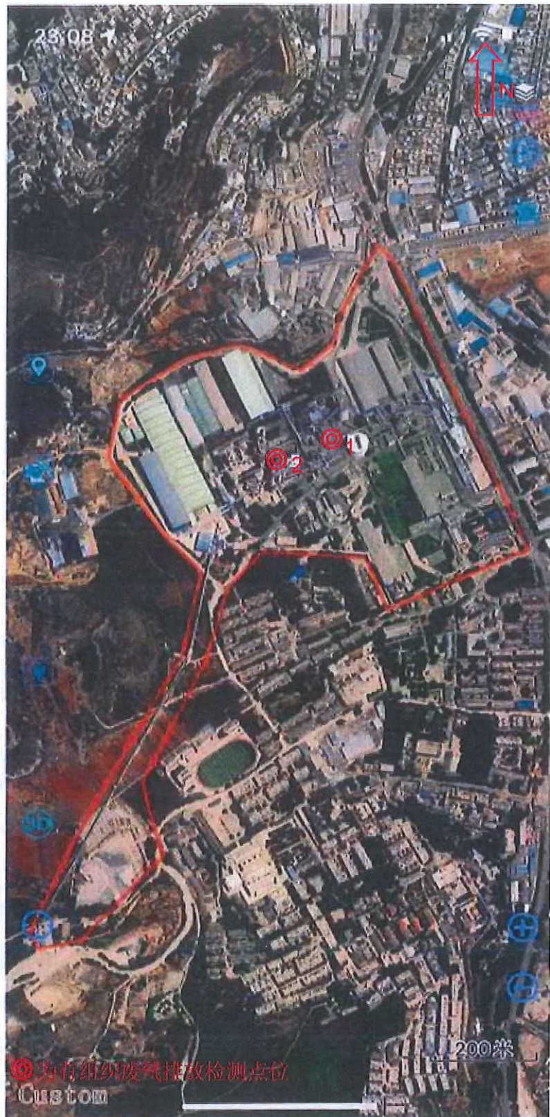
附件 1：检测点位示意图